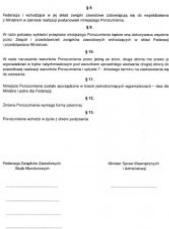
Propozycje MSWiA dla funkcjonariuszy - pełna treść projektu porozumienia

Zarówno minister Joachim Brudziński jak i wiceminister Jarosław Zieliński podkreślają, że Ministerstwo w każdej chwili jest gotowe podpisać porozumienie ze związkami zawodowymi. MSWiA podtrzymuje wszystkie wcześniejsze propozycje. Wśród nich są m.in. dodatkowe podwyżki i płatne w 100 proc. nadgodziny.