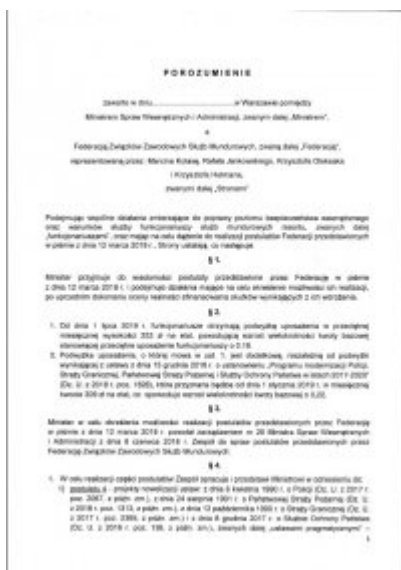
Propozycje MSWiA dla funkcjonariuszy – pełna treść projektu porozumienia