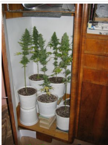
Konopie w szafie