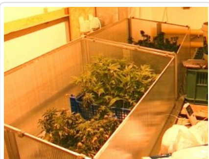
Plantacja w Suchym Lesie