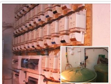
Plantacja w Suchym Lesie