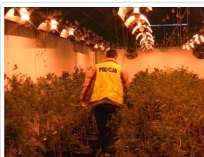
Plantacja w Suchym Lesie