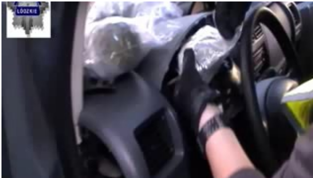
Film w formacie nieobsługiwany przez odtwarzacz. Pobierz plik 11 podejrzanych i ponad 80 kg narkotyków (format flv - rozmiar 5.38 MB)