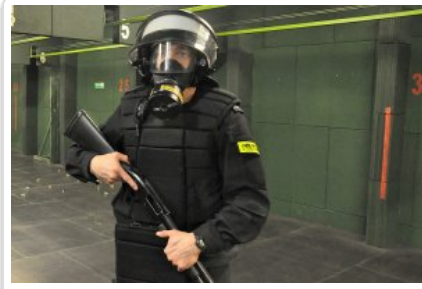
Strzelanie z pistoletu maszynowego