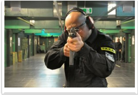
Strzelanie z karabinu maszynowego AKMS tzw. "kałasznikowa"