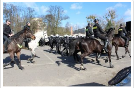
Film Wspólne ćwiczenia z policja konną