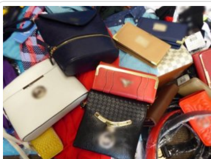
KWP w Szczecinie

Już po raz kolejny policjanci z Wydziału do Walki z Korupcją i Przystępczością Gospodarczą Komendy Miejskiej Policji w Koszalinie zabezpieczyli podrobione perfumy i odzież znanych firm. Wartość wszystkich zabezpieczonych towarów wyceniono na 80 tys. zł. Policjanci z Żar zabezpieczyli ponad 200 sztuk odzieży na której bezprawnie umieszczone było logo znanych marek. Towar był oferowany do sprzedaży na bazarze w Łęknicy. Czarnorynkowa wartość oryginalnych odpowiedników zabezpieczonego towaru to co najmniej 70 tys. zł.