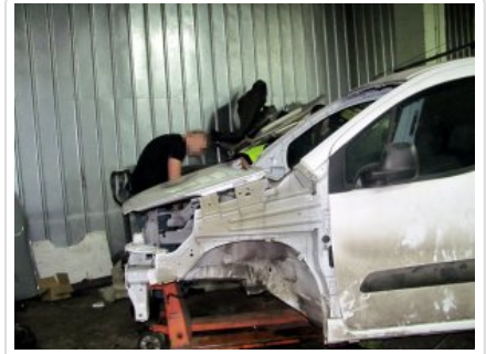
Film Zlikwidowana kolejna dziupla