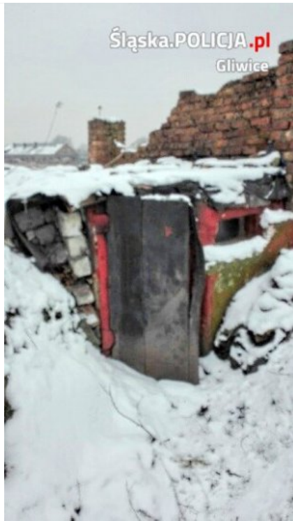
Ziemianka, w której zamieszkiwał pan Ryszard