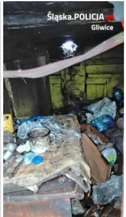
Wnętrze opuszczonej ziemianki