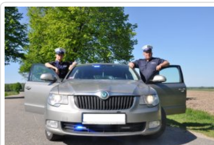
Braniewscy policjanci drogówki podczas służby #8