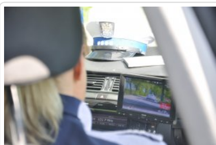
Braniewscy policjanci drogówki podczas służby #2

Obecnie bezpieczeństwa na trasach powiatu braniewskiego strzeże 12 policjantów – w tym 9 mężczyzn oraz 3 kobiety. Służbę w Komendzie Powiatowej Policji w Braniewie pełnią w systemie zmianowym 8-godzinny. Każdego dnia dwuosobowe patrole wyjeżdżają w rejon tuż po odprawie. Przez kolejne godziny funkcjonariusze, których nieodłącznym elementem umundurowania jest biała czapka, obecni są wszędzie tam, gdzie może dojść do łamania przepisów drogowych. To na ich widok kierowcy ściągają nogę z gazu, a piesi dwa razy się zastanowią, zanim zbyt pochopnie wejdą na jezdnię i czekają aż zapali się zielone światło.