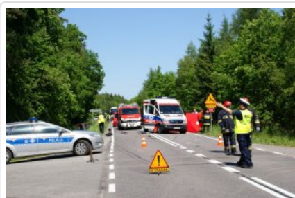
Braniewscy policjanci drogówki podczas służby #3