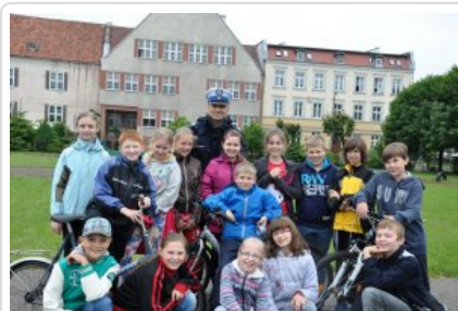
Braniewscy policjanci drogówki podczas służby #6

Zapewnienie porządku, bezpieczeństwa oraz płynności ruchu to nie jedyne zadania funkcjonariuszy. Policjanci udzielają również niezbędnej pomocy podróżującym, ale także włączają się aktywnie w propagowanie bezpiecznego korzystania z dróg, szczególnie wśród dzieci i młodzieży. Do jednych z podstawowych obowiązków policjantów z ogniwa ruchu drogowego należy wykonywanie czynności na miejscach zdarzeń. Widok policjanta w białej czapce, który zabezpiecza miejsca wypadku, czy kolizji drogowej nie dziwi przecież nikogo.