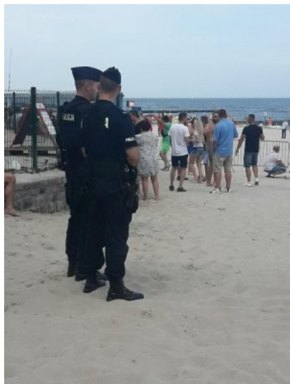
Bezpieczeństwo nad morzem - nasz wspólny cel