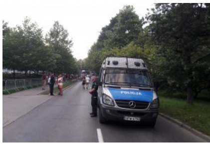
Bezpieczeństwo nad morzem - nasz wspólny cel