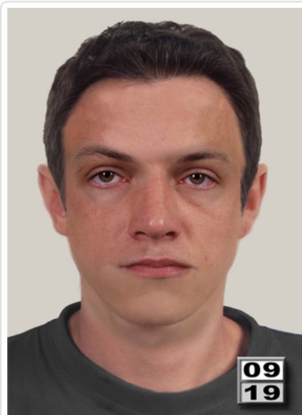
Portret pamięciowy - zabójstwo w Krośnie - 2009

Wydział Dochodzeniowo-Śledczy Komendy Wojewódzkiej Policji w Rzeszowie wykonuje czynności zlecone w sprawie zabójstwa mieszkańca Krosna, dokonanego w lipcu 2009 r. Śledztwo prowadzi Prokuratura Okręgowa w Krośnie.