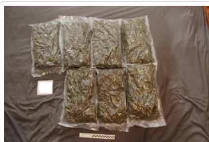
zabezpieczone przez policjantów narkotyki