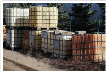
Prokuratura Cottbus Biuro Prasowe

Aby obejrzeć film włącz obsługę JavaScript w swojej przeglądarce.