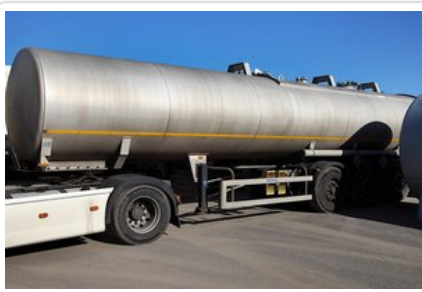
Prokuratura Cottbus Biuro Prasowe