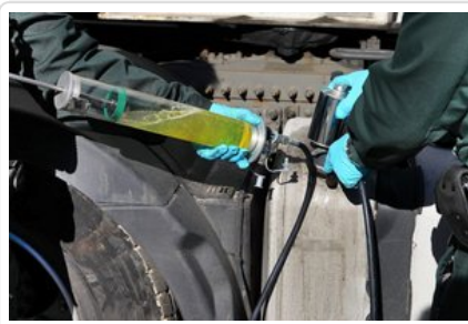
Prokuratura Cottbus Biuro Prasowe