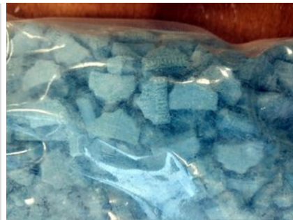
Zabezpieczone przez policjantów narkotyki