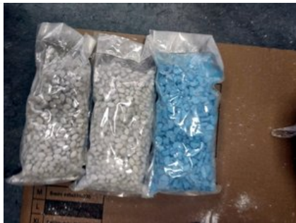
Zabezpieczone przez policjantów narkotyki