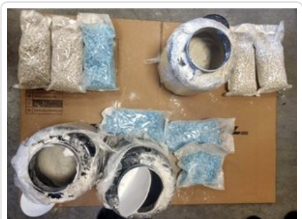
Zabezpieczone przez policjantów narkotyki