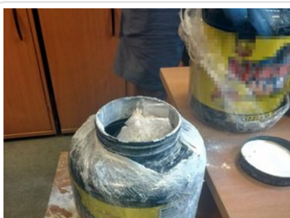
Zabezpieczone przez policjantów narkotyki

Aby obejrzeć film włącz obsługę JavaScript w swojej przeglądarce.