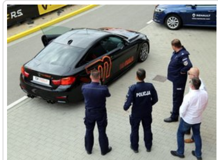
Kurs doskonalący technikę jazdy samochodem osobowym