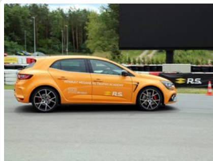
Kurs doskonalący technikę jazdy samochodem osobowym