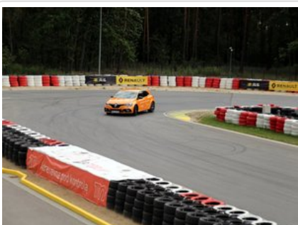
Kurs doskonalący technikę jazdy samochodem osobowym