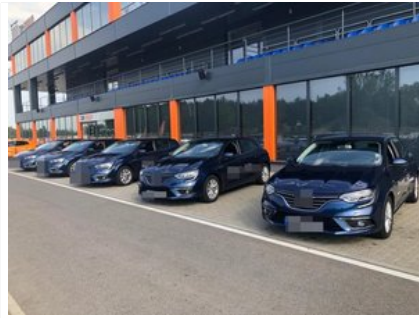
Kurs doskonalący technikę jazdy samochodem osobowym