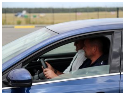
Kurs doskonalący technikę jazdy samochodem osobowym