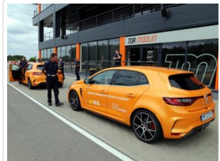
Kurs doskonalący technikę jazdy samochodem osobowym