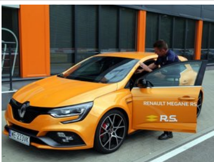
Kurs doskonalący technikę jazdy samochodem osobowym