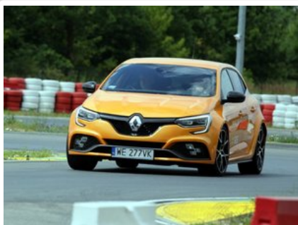
Kurs doskonalący technikę jazdy samochodem osobowym