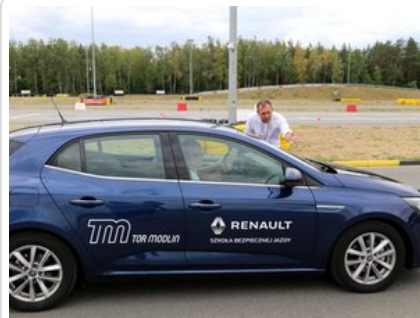
Kurs doskonalący technikę jazdy samochodem osobowym