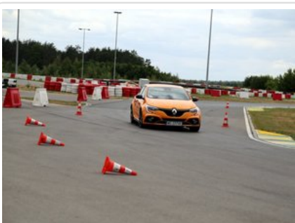
Kurs doskonalący technikę jazdy samochodem osobowym