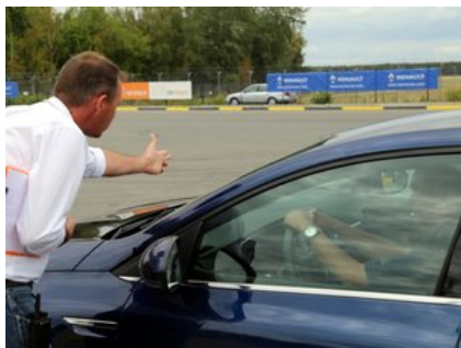
Kurs doskonalący technikę jazdy samochodem osobowym