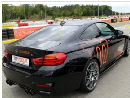
Kurs doskonalący technikę jazdy samochodem osobowym