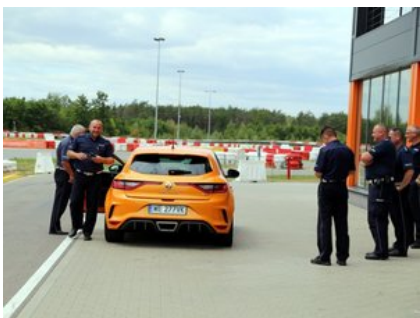
Kurs doskonalący technikę jazdy samochodem osobowym