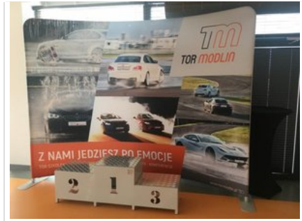
Kurs doskonalący technikę jazdy samochodem osobowym