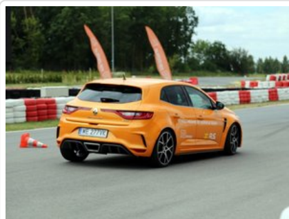
Kurs doskonalący technikę jazdy samochodem osobowym