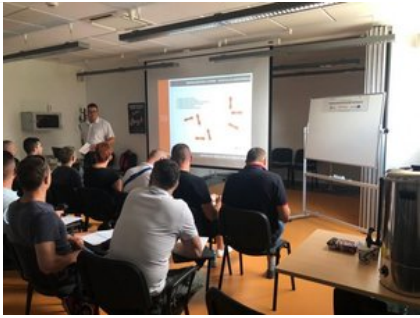
Kurs doskonalący technikę jazdy samochodem osobowym