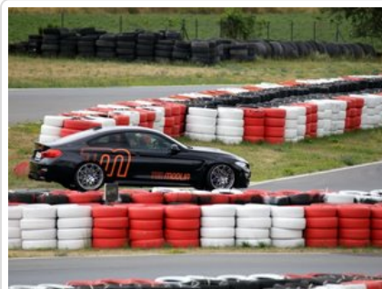
Kurs doskonalący technikę jazdy samochodem osobowym