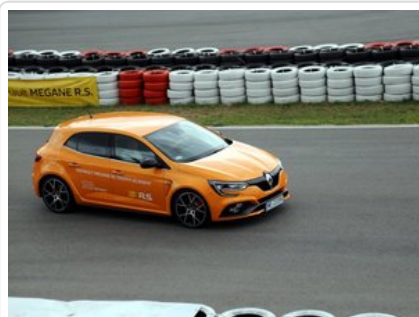
Kurs doskonalący technikę jazdy samochodem osobowym