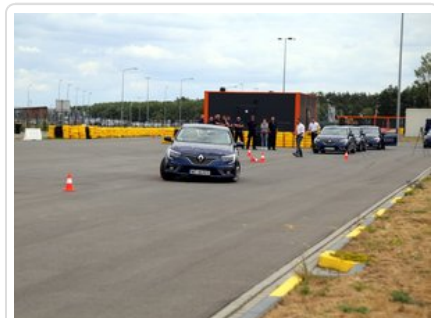
Kurs doskonalący technikę jazdy samochodem osobowym