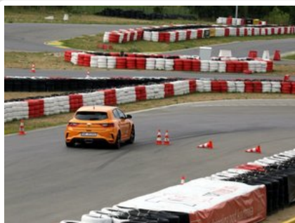
Kurs doskonalący technikę jazdy samochodem osobowym