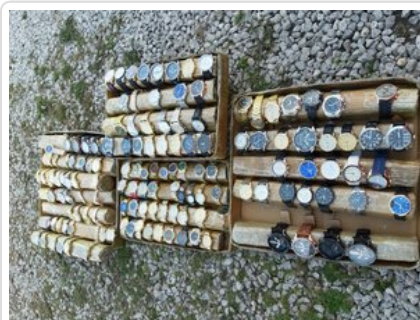
Zabezpieczone przez funkcjonariuszy podróbki