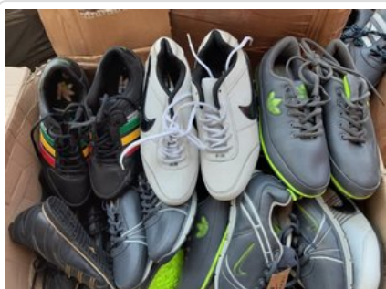
Zabezpieczone przez funkcjonariuszy podróbki