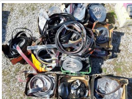
Zabezpieczone przez funkcjonariuszy podróbki