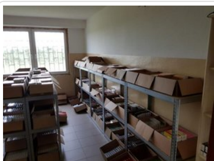
Zabezpieczone przez funkcjonariuszy podróbki