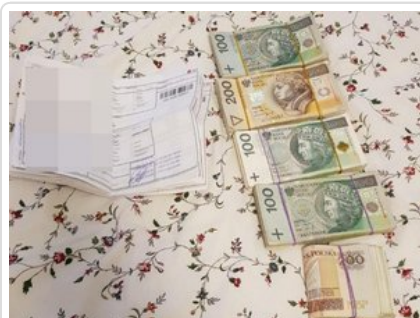
Zabezpieczone przez funkcjonariuszy pieniądze