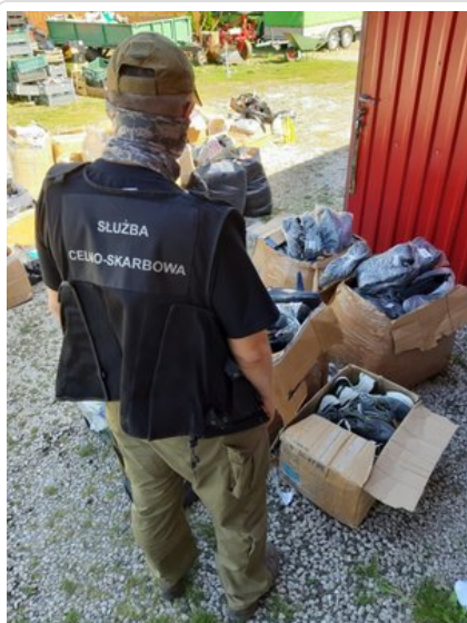
Zabezpieczone przez funkcjonariuszy podróbki