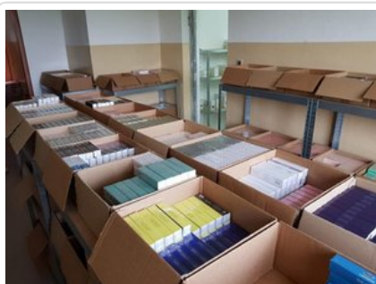
Zabezpieczone przez funkcjonariuszy podróbki