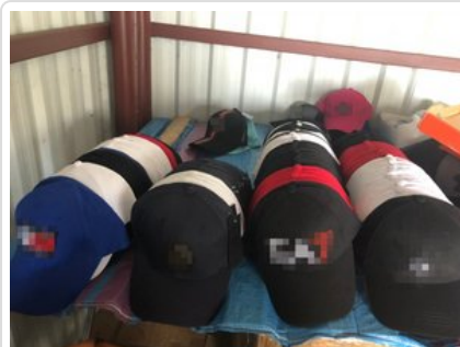
Zabezpieczone przez funkcjonariuszy podróbki