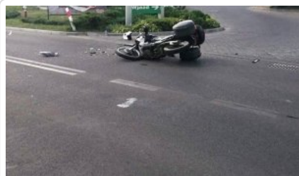
Miejsce zdarzenia drogowego w powiecie kętrzyńskim