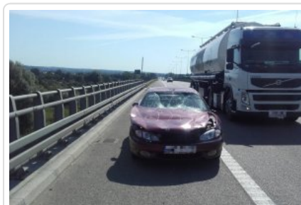
Interwencja na S7