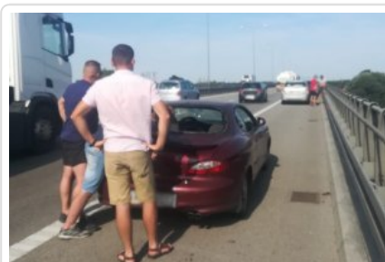
Interwencja na S7