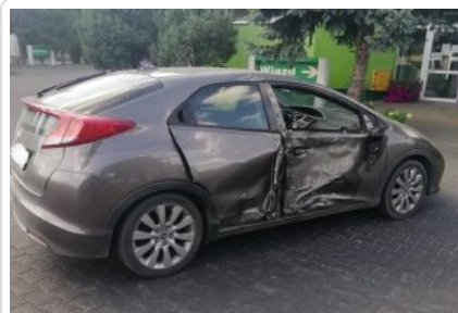
Miejsce zdarzenia drogowego w powiecie kętrzyńskim