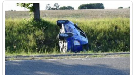
Zdarzenie drogowe w powiecie ełckim