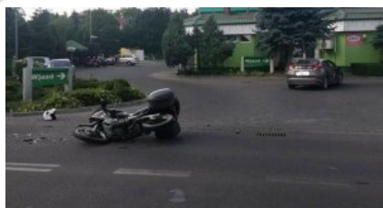
Miejsce zdarzenia drogowego w powiecie kętrzyńskim