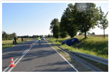
Zdarzenie drogowe w powiecie ełckim

Policjanci pracowali w niedzielę na miejscu zdarzenia drogowego na drodze krajowej nr 16 na trasie Golubka - Sędko. Z dotychczasowych ustaleń wynika, że 24-letnia kierująca skodą z nieznanых przyczyn zjechała na lewe pobocze, uderzając w barierkę ochronną. Potem jej pojazd zjechał do przydrożnego rowu po drugiej stronie jezdni, gdzie przewrócił się na bok. Kobieta była trzeźwa. Jechała z 3-letnim dzieckiem. Oboje trafili do szpitala na badania. Policjanci ustalają teraz wszystkie okoliczności tego zdarzenia.