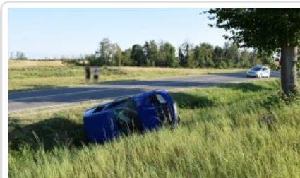
Zdarzenie drogowe w powiecie ełckim