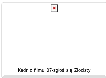
Kadr z filmu 07-zgłoś się Złocisty

Już od dziesięcioleci śmigłowce na całym świecie pomagają policjantom w działaniach, nic więc dziwnego, że trafiły też na małe i duże ekrany. I to dokładnie te maszyny, które na co dzień pełnią prawdziwą służbę. Nie inaczej jest u nas, w kraju nad Wisłą.