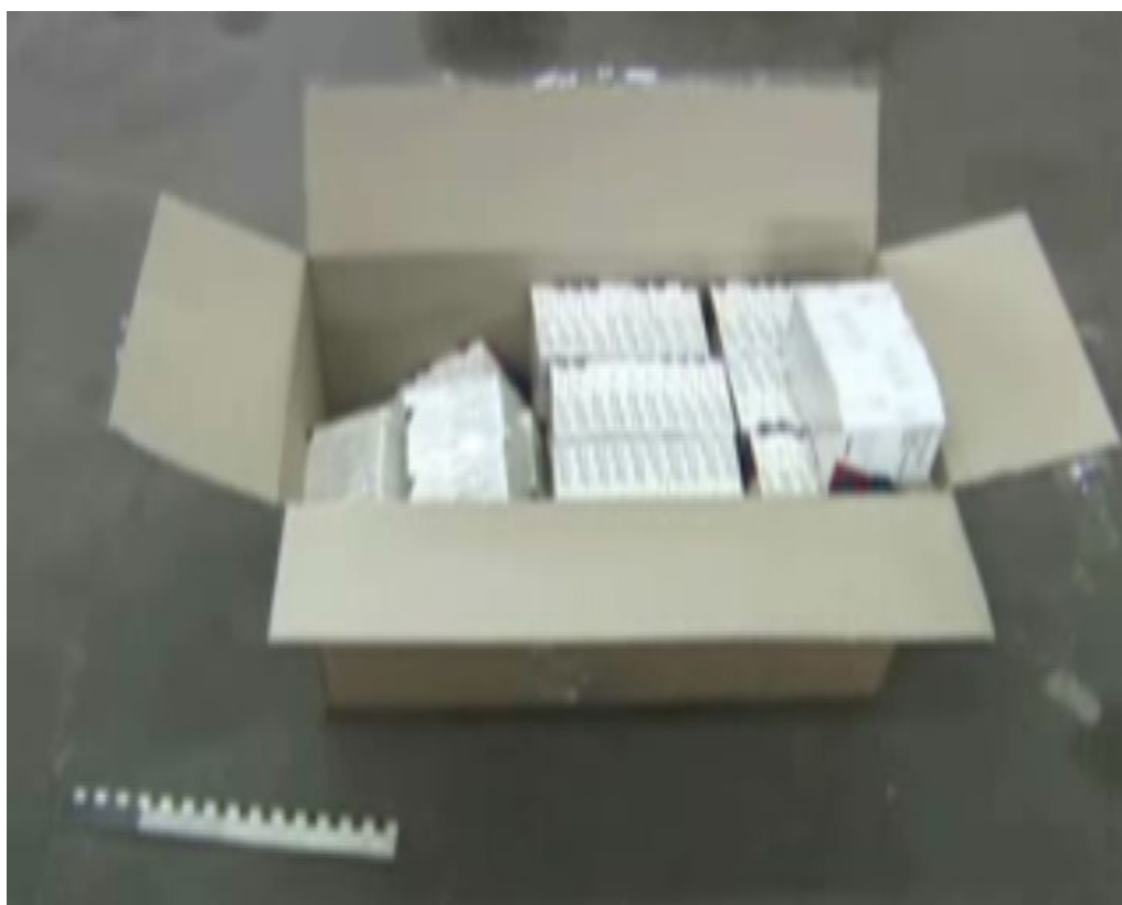
Film w formacie nieobsługiwany przez odtwarzacz. Pobierz plik Zatrzymani za kradzież leku wartego 5 mln złotych (format flv - rozmiar 1.52 MB)