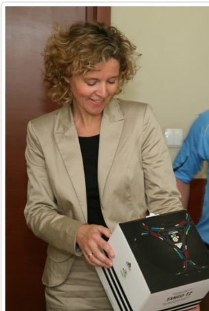
Pożegnanie niemieckich policjantów